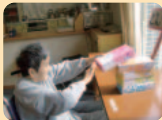
♡台車に乗って私に会いに来て