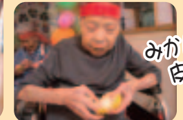
みかんの皮むき競争