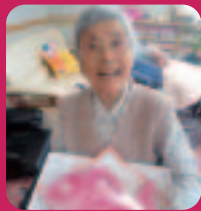
祝・敬老の日 - 天花 -

だんだんと朝晩の冷え込みが厳しくなってきましたね。猛暑のあとの、つかの間の「秋」という感じでしたが、恒例のお出掛けや運動会を楽しみました。こころ/うらら/わかばには、越賀中学校2年生のみなさんが職場体験学習に来てくれました。各施設で見つけた「いろんな秋」をご紹介します！