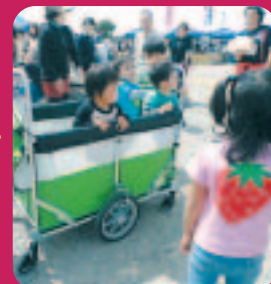
5/4・あわびフェアへ

新緑の季節となりました。かねてから建設中の企業内保育所「キッズアカデミーつばさ」が、5月1日オープンしました！(場所は特定施設わかばの南側)0歳から12歳までのスタッフの子供たちが対象です。子育て中でも、安心して働いてもらえる環境づくりをしていきます。