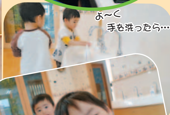
よ〜く 手を洗ったら...