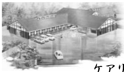
ショートステイ飛鳥