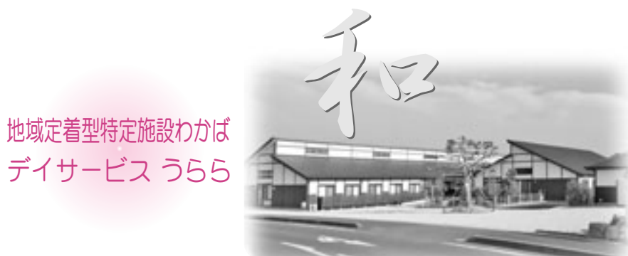
ケアリゾート 庭園