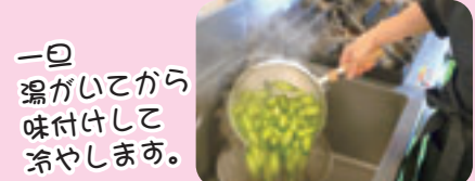
一旦湯がいてから味付けして冷やします。