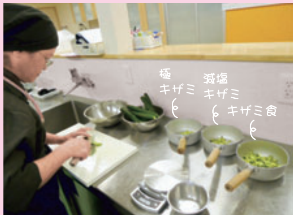
衛生上、生野菜はお出ししません。

早かった梅雨明けの後は連日の猛暑日…。今年の夏は長くなりそうですね。体調管理をしっかりとしないとイケませんね。さて、今回は“食”特集です。ケアリゾートの食事はメニューや作り方を工夫して、できるだけ家庭の味を出せるように心がけています。