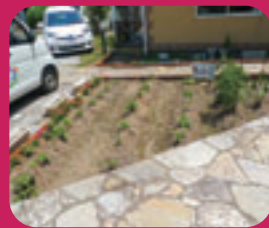
夏野菜を植えました♪ —こころ—

早かった梅雨明けの後は連日の猛暑日…。今年の夏は長くなりそうですね。体調管理をしっかりとしないとイケませんね。さて、今回は“食”特集です。ケアリゾートの食事はメニューや作り方を工夫して、できるだけ家庭の味を出せるように心がけています。