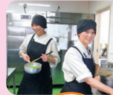
3施設それぞれの厨房で毎日手作りしています。