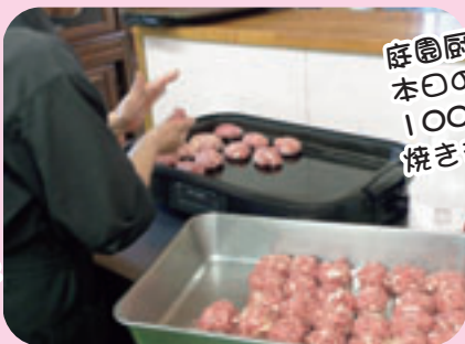
庭園厨房、本日のお昼は100個ほど焼きます。