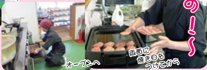
両面に焼き目を付けてから